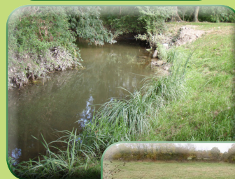
Protection de berge en génie végétal