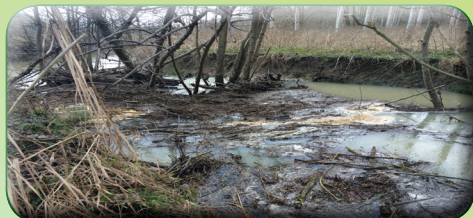
Cours d'eau avec embâcles

● En aucun cas, l'intervention mécanique dans le lit mineur d'un cours d'eau n'est autorisée, sauf accord explicite de l'administration.