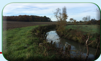
Coupe à blanc