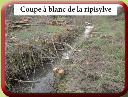
Coupe à blanc de la ripisylve