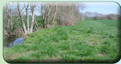
Ripisylve bien entretenue

L'élagage des branches basses de la ripisylve a pour objectif de ne pas freiner l'écoulement des eaux mais aussi d'apporter de la lumière au niveau du cours d'eau. Il doit être partiel et non systématique.